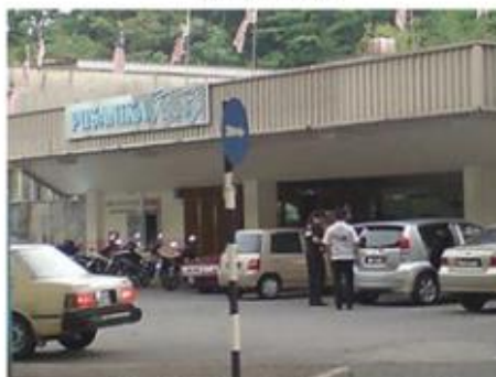
一站式学生服务中心