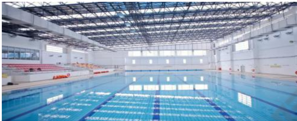
奥 林匹克标准游泳池 Olympic standard swimming pool