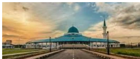
苏丹依布拉欣清真寺 Sultan Ibrahim Mosque