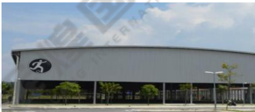
体 育馆 Stadium