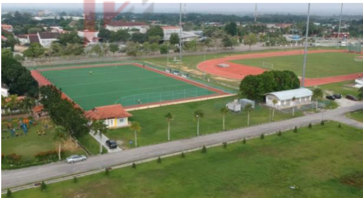
操 场 Sports field